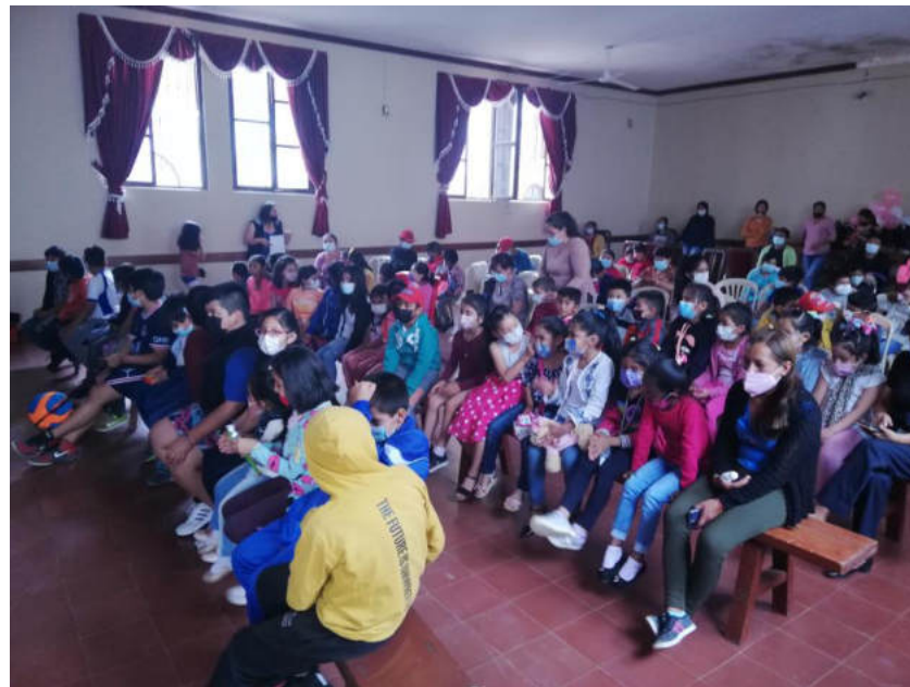
Padcaya – Tarija – Títeres Un Cachito de Alfaro