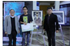
Artistas Emergentes Cochabamba