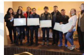
Artistas Emergentes Oruro