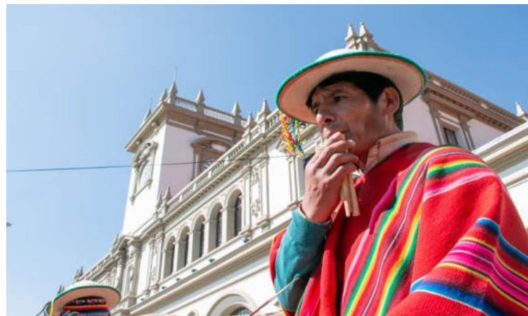
Exposición Kallawayá Soq'en Ikaj Mach'a en el CRC