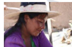
Exposición Encantos de Luna