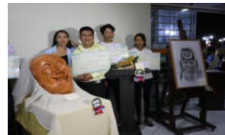
Artistas Emergentes Beni