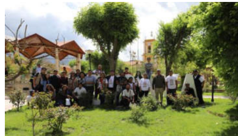
Artistas Muralistas – Padcaya - Tarija