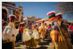
Exposición San Roque