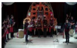
Exposición Todos los Santos