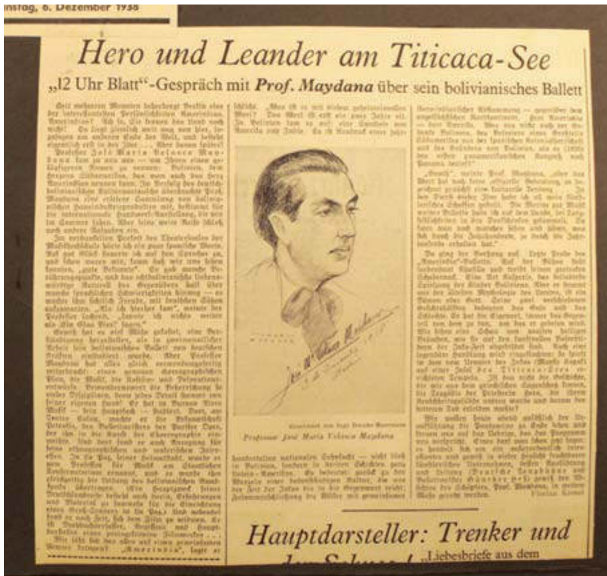
Reseña en la prensa alemana | periódico "12 horas"