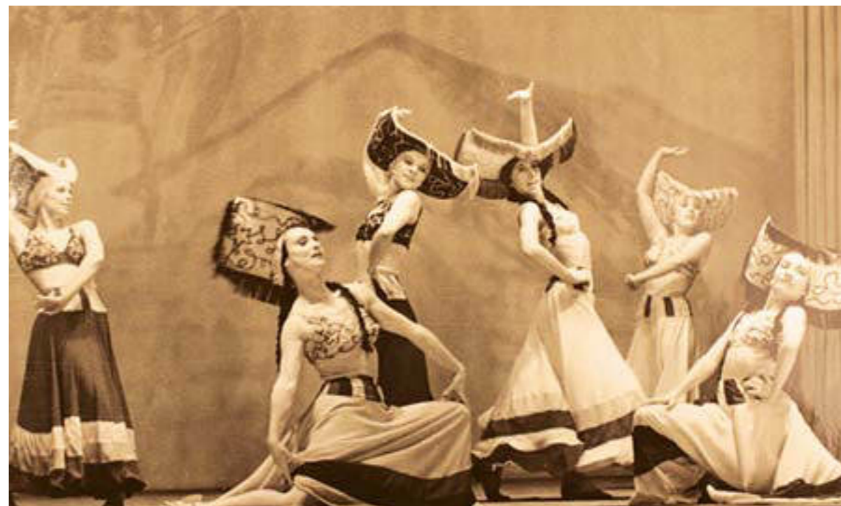
Escenas de Amerindia