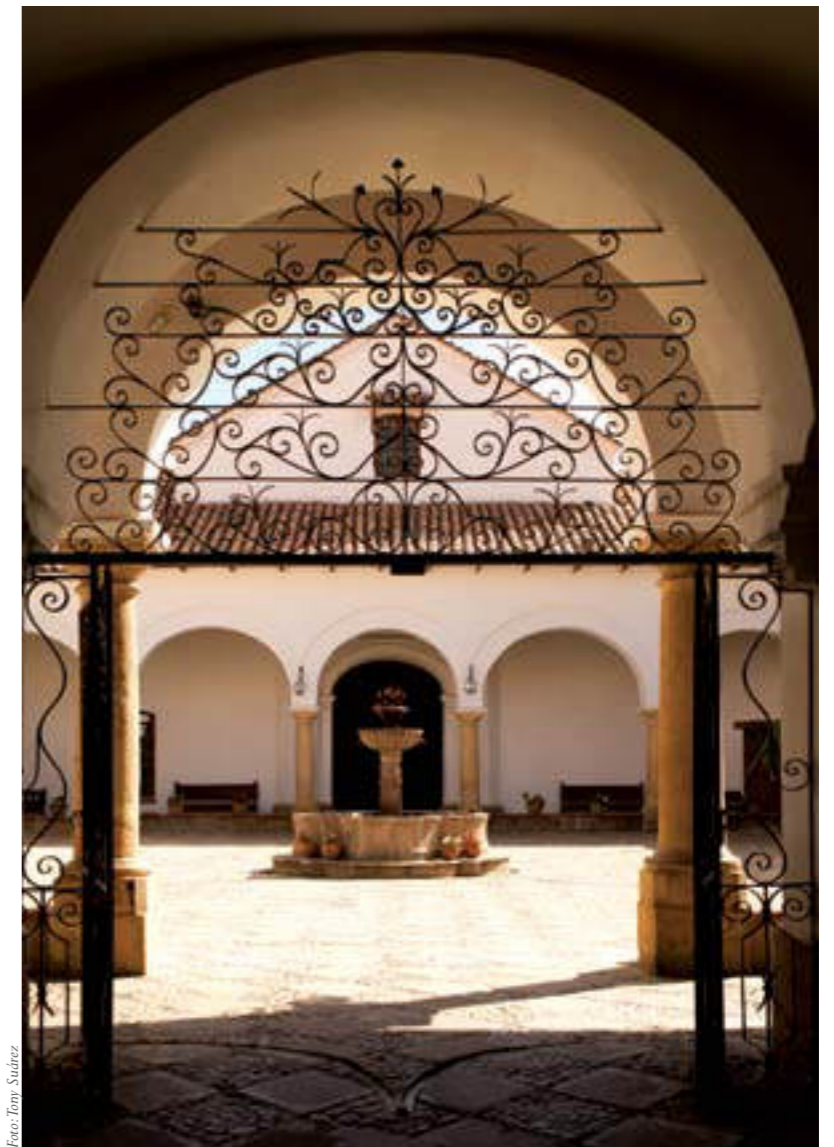
Ingreso Casa de la Libertad | Sucre