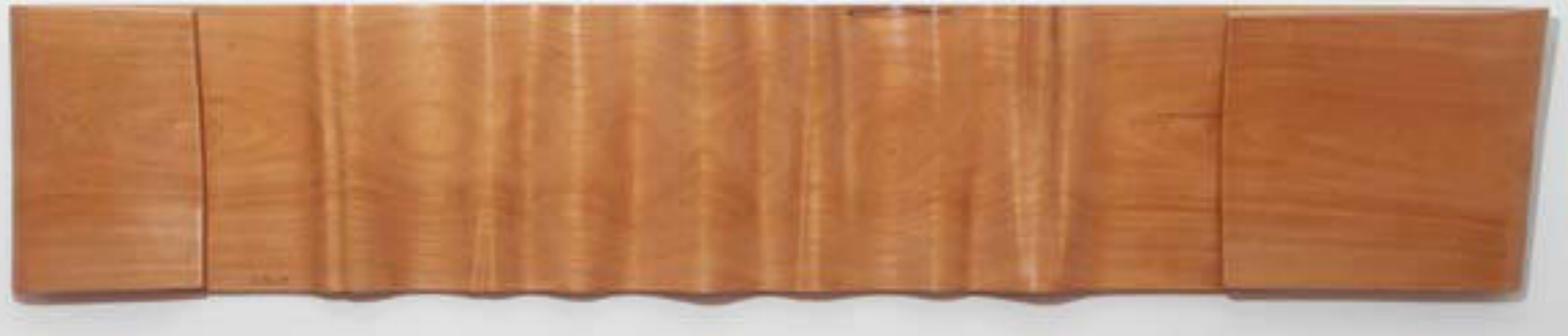
Pliegue | 1997 | Colección MNA

Marcelo Callaú, sin duda uno de los grandes escultores de nuestro país y el más importante que ha tenido Santa Cruz en el siglo XX, fue también dibujante, pintor, grabador y fotógrafo. Su obra es sensible, sintética, sutil, creativa, experimental y original; su escultura, en principio costumbrista y figurativa - los femeninos torsos sensuales y las manos agrupadas nos hablan de su relación tan próxima a los seres humanos-, se transforma con el tiempo, luego de una experiencia espiritual en la selva, en abstracta. Él mismo lo explicó así en una entrevista publicada por la revista Cosas en agosto de 1999: “Quería encontrar mis raíces, era un artista boliviano que no sabía de qué estaba orgulloso. Me fui a Caparuch y reflexioné mucho. Allí vi afuera, la belleza y la angustia de la selva. Había hecho siempre figuras humanas pero a partir de ese momento pensé en abstracto. Hice un análisis