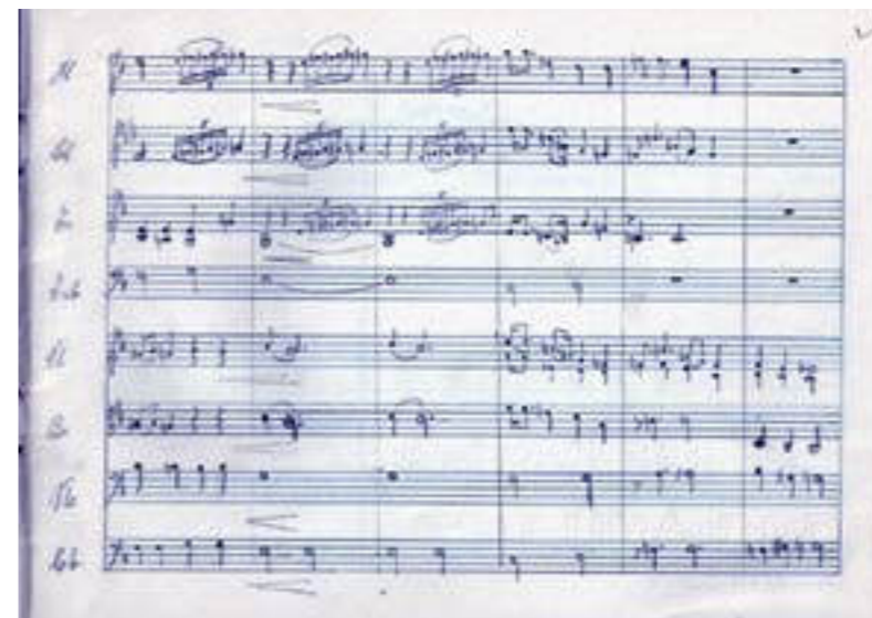
Muestra del trabajo compositivo de Velasco Moidana