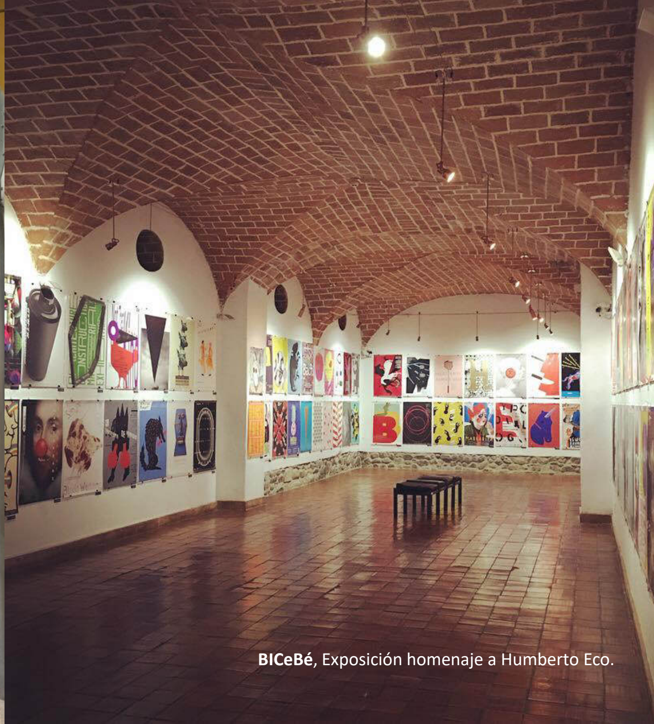
BICeBé, Exposición homenaje a Humberto Eco.