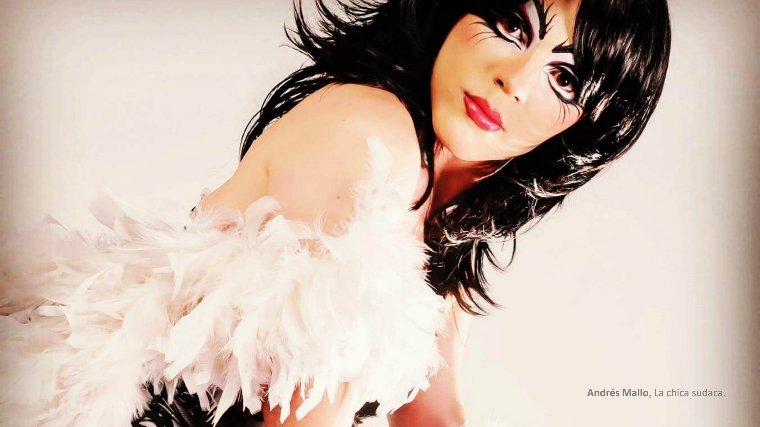
Andrés Mallo, La chica sudaca.