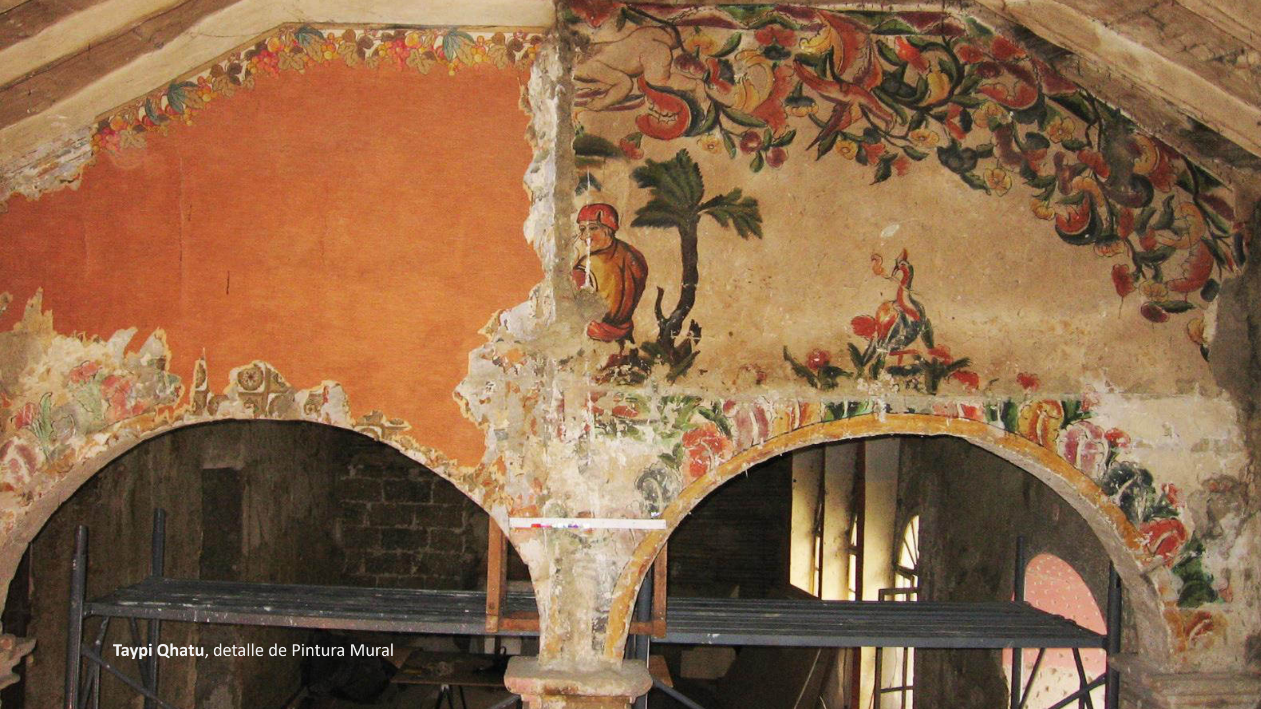
Taypi Qhatu, detalle de Pintura Mural