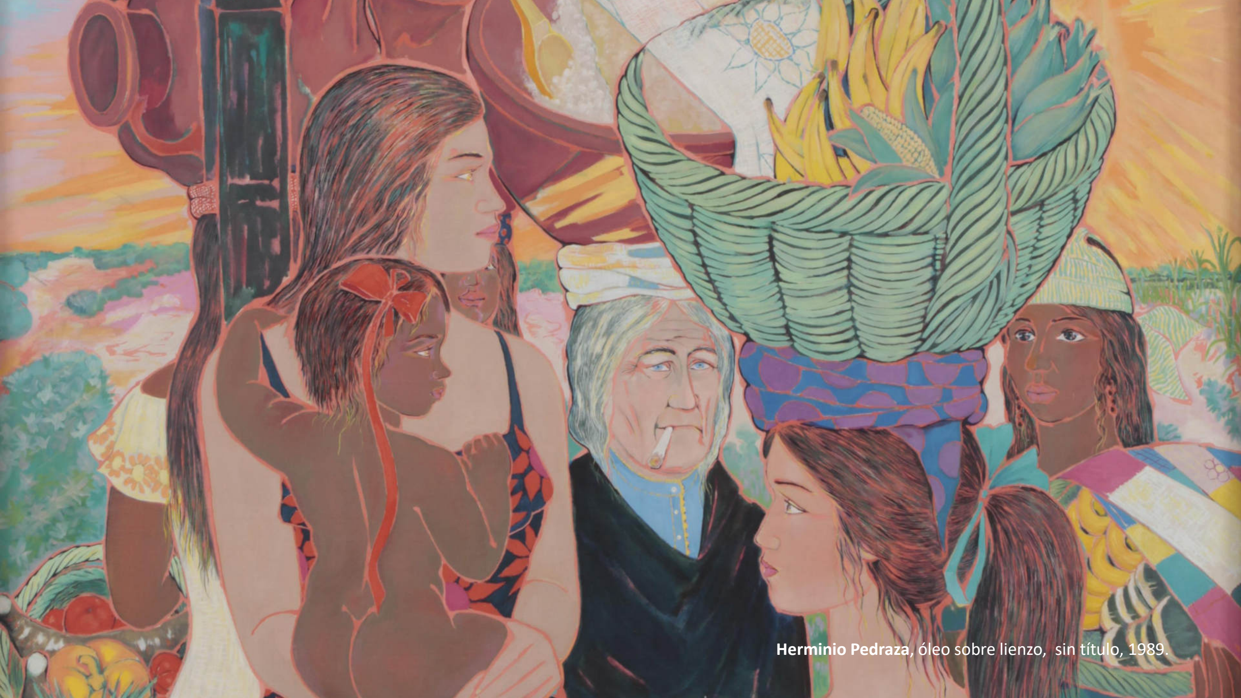
Herminio Pedraza, óleo sobre lienzo, sin título, 1989.