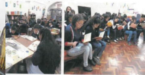
Educativa: Andrés de Santa Cruz, Primaria - Tarija, Bermejo