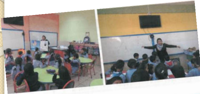
Jardín Infantil: Gerardo Vaca Guzmán

EJECUTAR ACTIVIDADES DE EDUCACIÓN, SEGÚN LA VOCACIÓN DEL ÁREA ORGANIZACIONAL