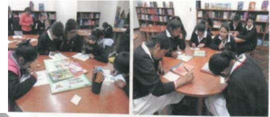
Educativa: Franciscana San Juanillo