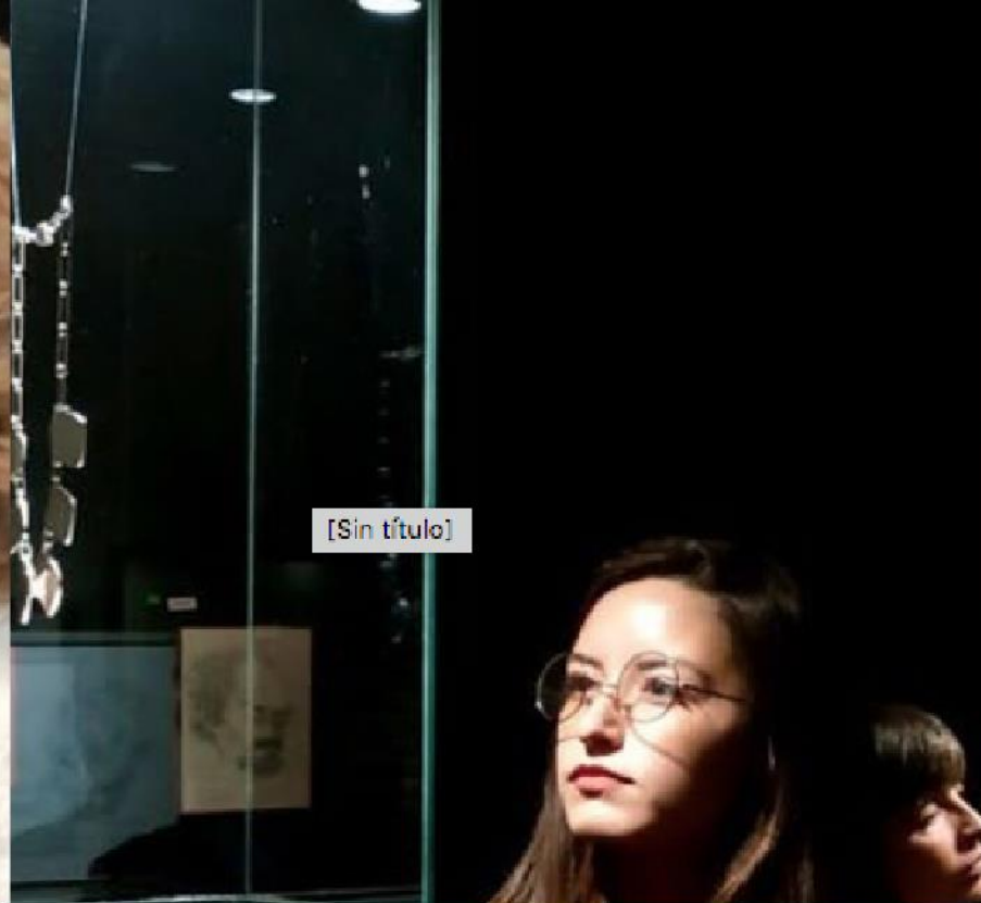
Diseño por Abstracción, en torno a la obra de Inés Córdova en la muestra: Homenaje a un amor