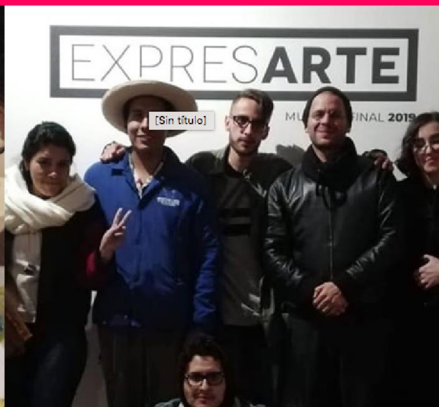
Jornada de reflexión sobre la exposición EXPRESARTE