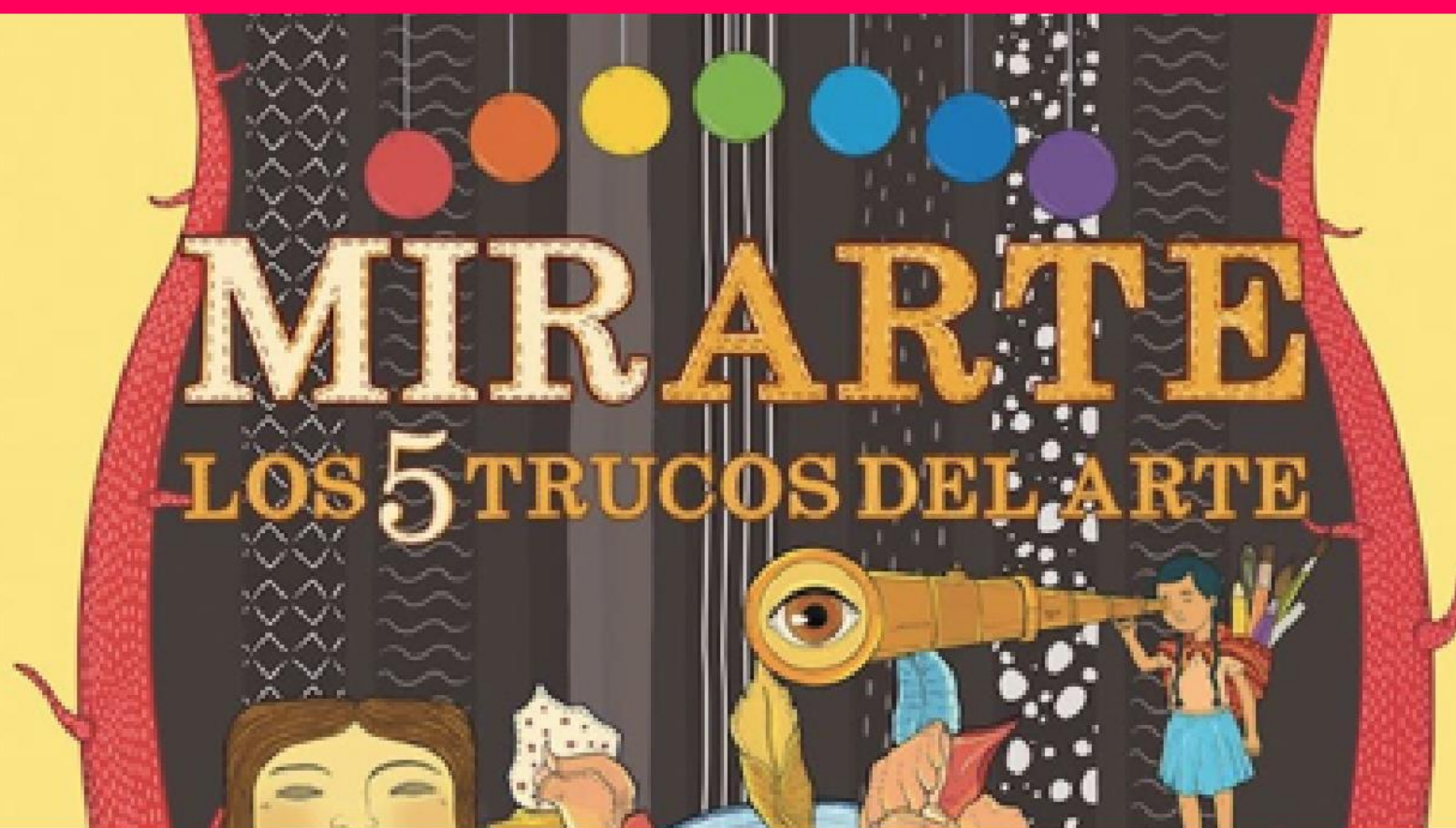
Libro Mirarte (Educación)