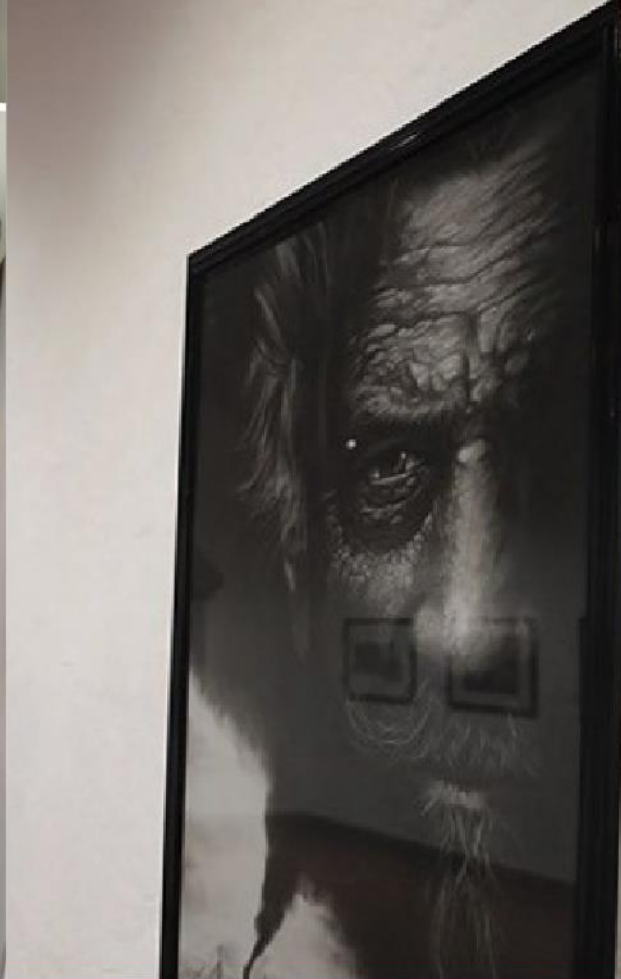
Premio Eduardo Abaroa