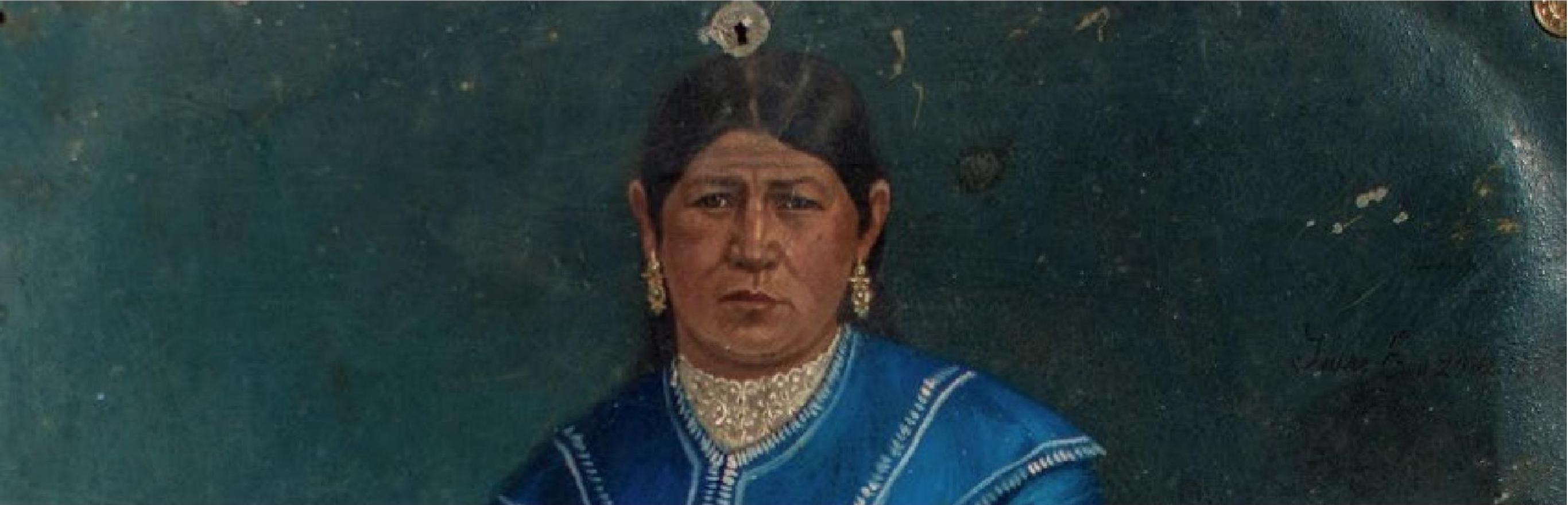
Las visibilidades de las mujeres del poder. Retratos pintados de 1825 - 1925 (Siglo XIX) - (Investigación)