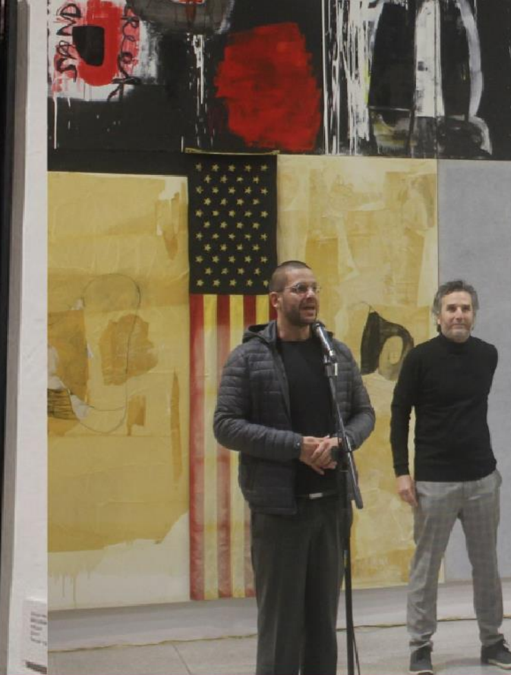
Grosso Modo de Keiko Gonzalez