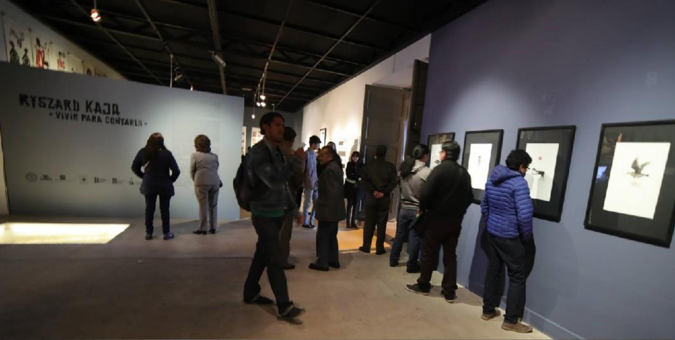
Vivir para contarla de Ryszard Kaja (Manzana 1 -Polonia)