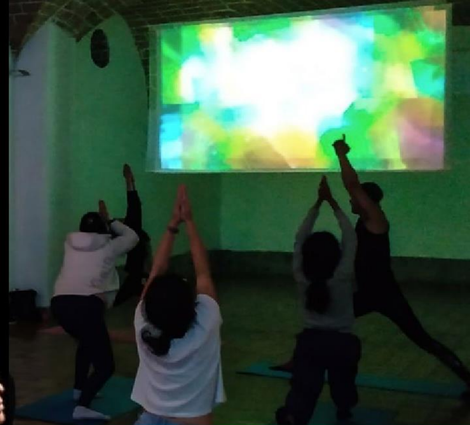
Yoga en la Rapsodia. Otra forma de contemplar y vivir el arte. En torno a la muestra Rapsodia de luz