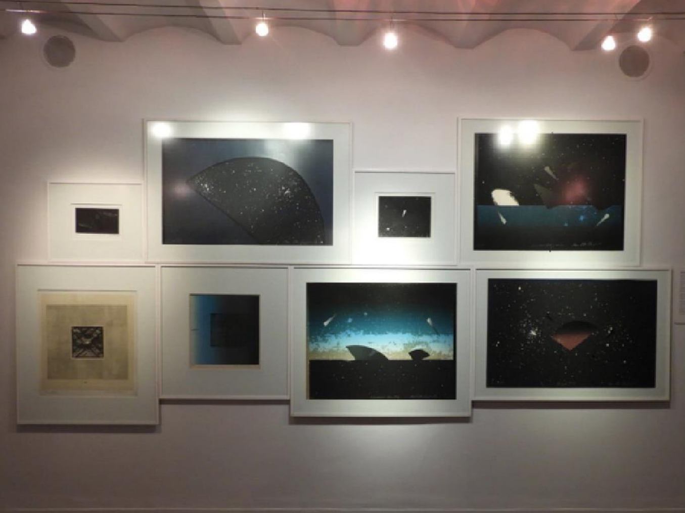
Bienal SIART (Santa Cruz y Cochabamba)