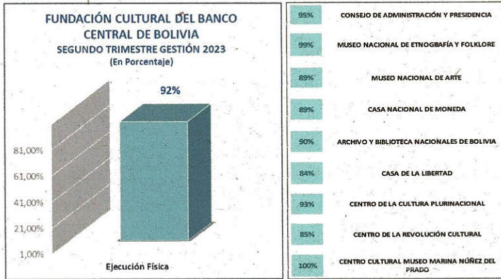
GRÁFICO N°1 EJECUCIÓN OPERATIVA DE RESULTADOS PROGRAMADOS ENTRE ABRIL A JUNIO