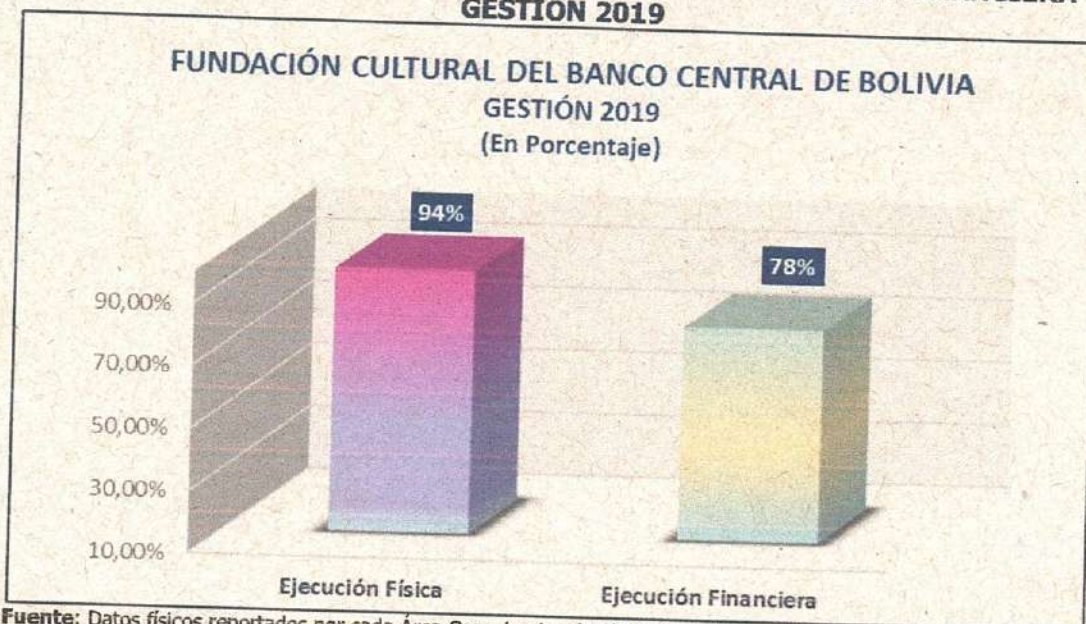
GRÁFICO N°1 EVALUACIÓN ANUAL DE LA EJECUCIÓN FÍSICA-FINANCIERA GESTIÓN 2019