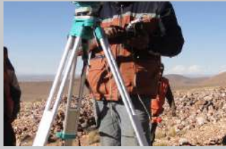
Pág. 14-15 "Mesa de Plata" la nueva veta "Salvadora" de Bolivia