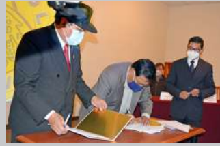
Pág. 6 Banco Central de Bolivia y COMIBOL firman acuerdo

AÑO 10 • N° 81 • mayo de 2021 • 16 PÁGINAS