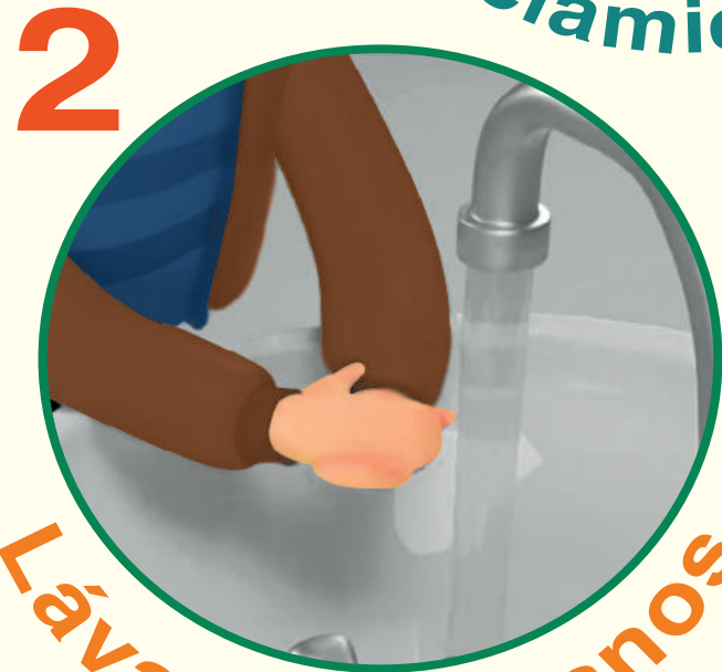
Lávate las manos