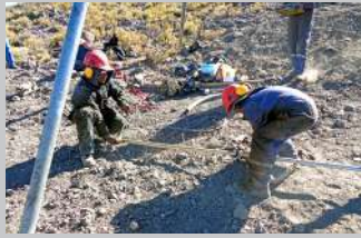
Pág. 8-9 Audiencia de Rendición de Cuentas inicial 2021