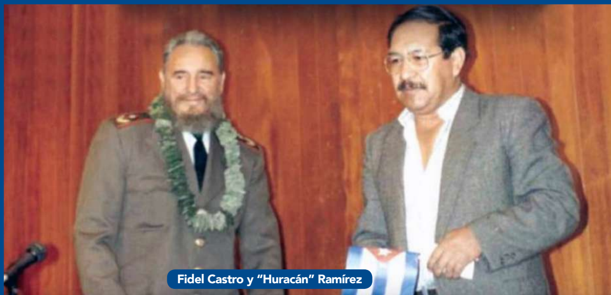
Fidel Castro y "Huracán" Ramírez